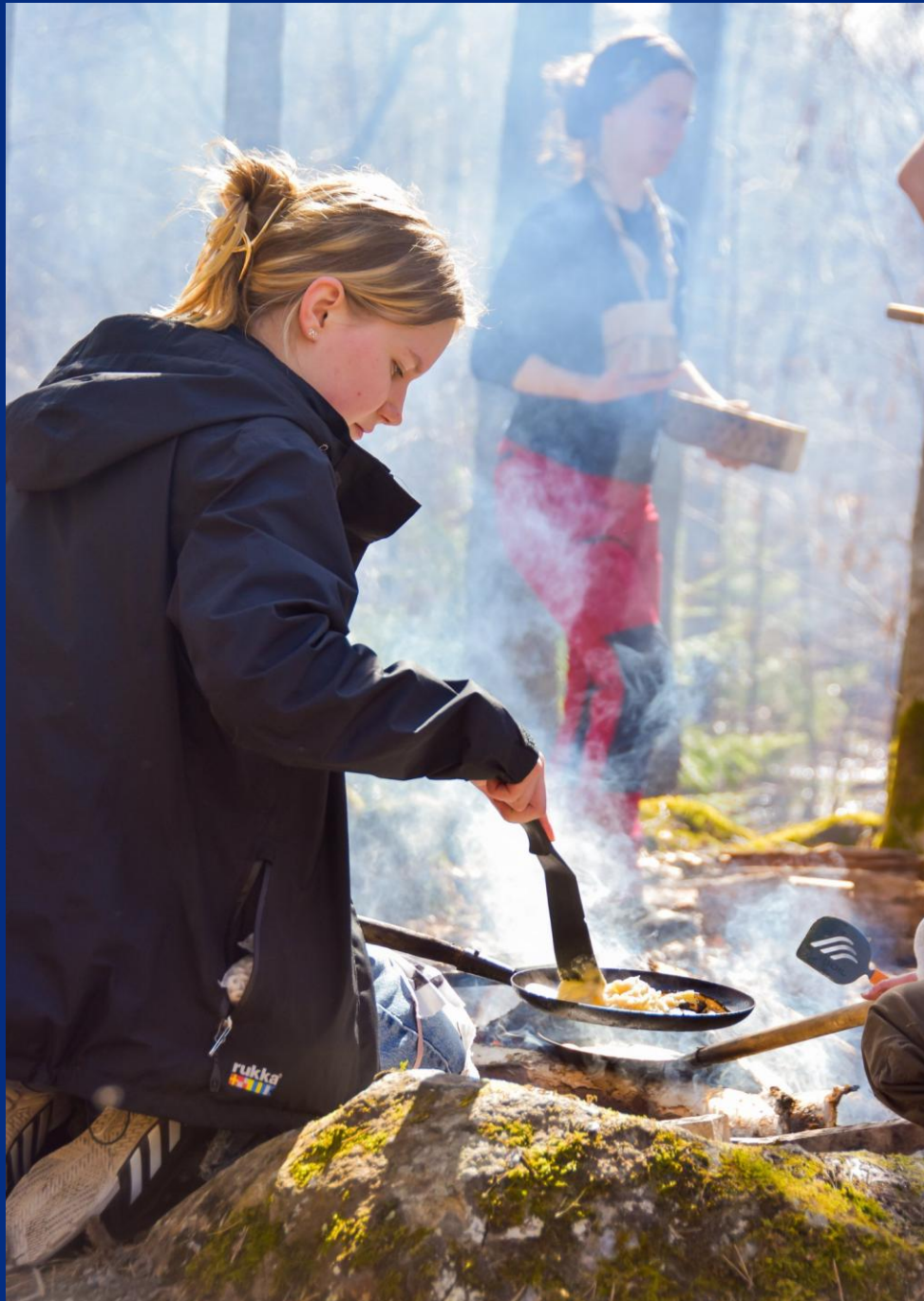
Merkkipäivät-kevätkisat 2024