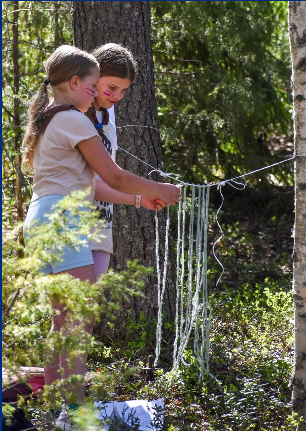
Kuva: Nella Ruonala / Sudenpentu- ja seikkailijajaksat 2024