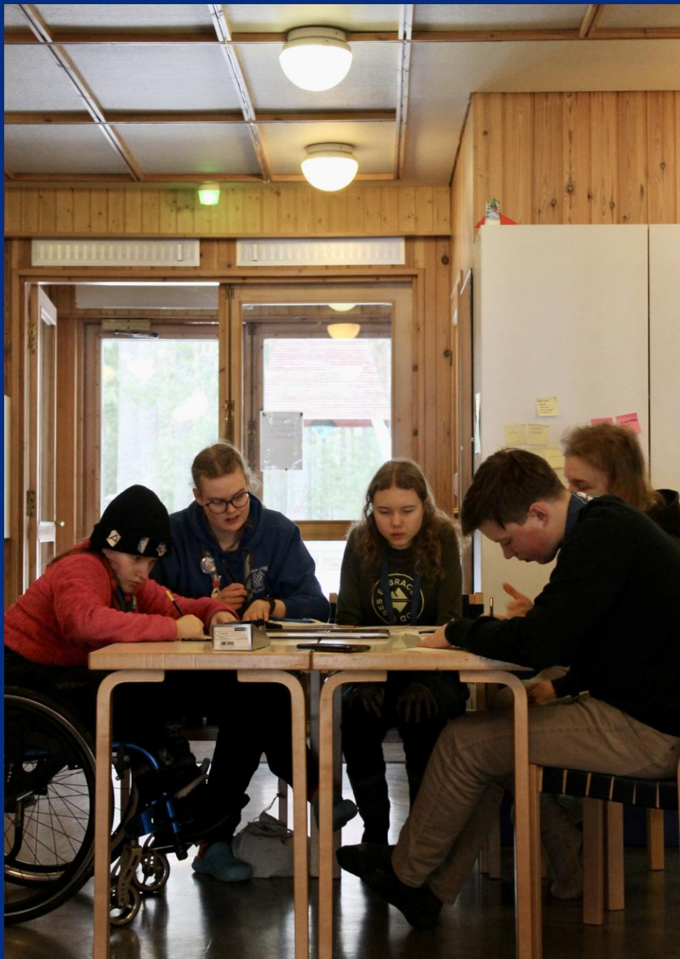
Kuva: Kerttu Mustonen / PIPK 1/2024